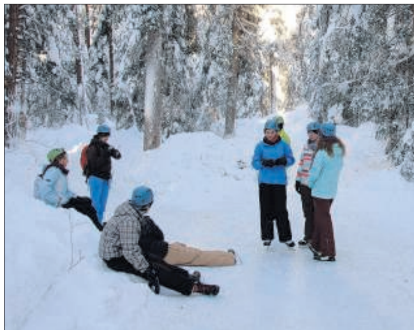
Ijsvrij: In Sur En is een ijsbaan aangelegd. De route gaat tussen de bomen door omhoog en weer omlaag.