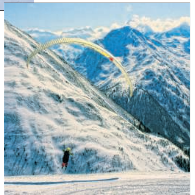
Dan liever de lucht in: Muottas Muragl is populair bij schermvliegers.

Vollemaansrit met de RhB: inclusief versnaperingen aan boord en driegangendiner in Alp Grüm €65. Sleetje vanaf Preda: treinticket Bergün-Preda en sleehuur samen €8. Kabeltreinretour voor Muottas Muragl: €25 (hotelgasten reizen gratis). Schaatsen in Sur En: €8, huur van een hockeyschaatsen en helm: €4.