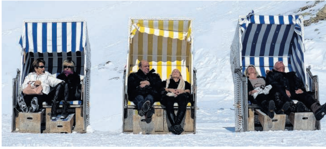
Gestreept: Muottas Muragl is ook een geliefde plek voor zonzonabidders.