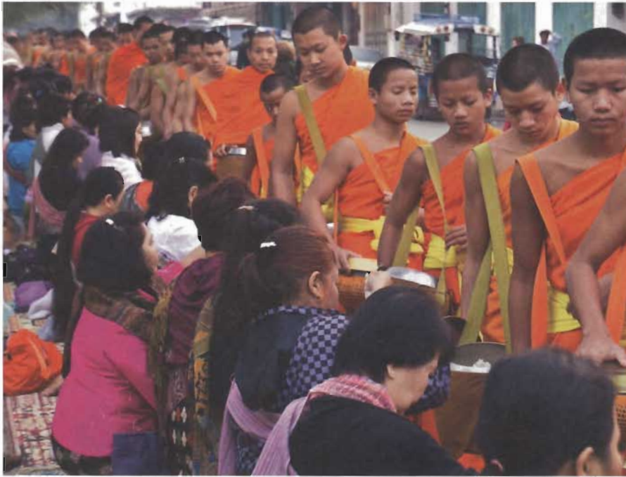
Het Tak Bat-ritueel: monniken ontvangen aalmoezen

▶ een medisch noodgeval snel naar een ziekenhuis in Bangkok wilde. Veel animo om naar Laos te komen, was er dan ook niet.”