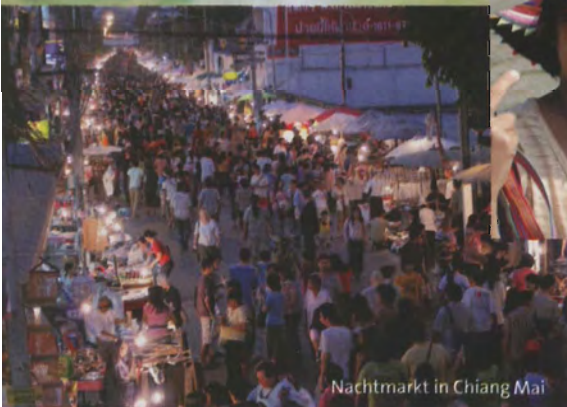
Nachtmarkt in Chiang Mai