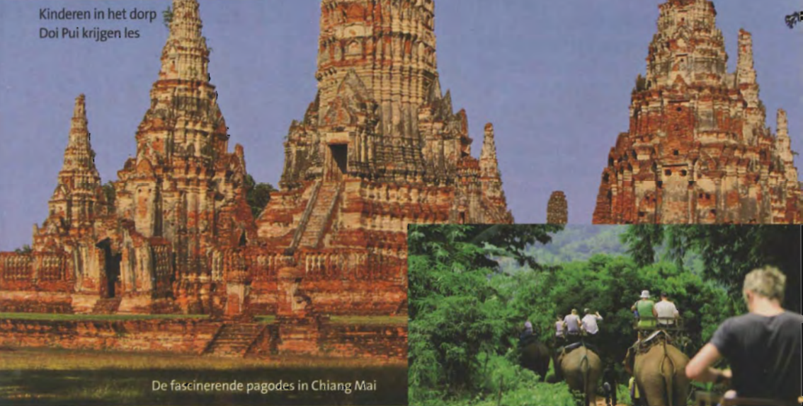
De fascinerende pagodes in Chiang Mai