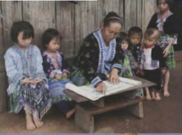
Kinderen in het dorp Doi Pui krijgen les